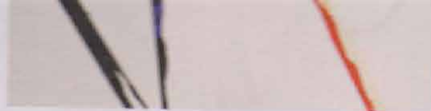
Matisse Art Galerie