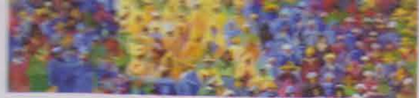
Design & Co au Sofitel Marrakech